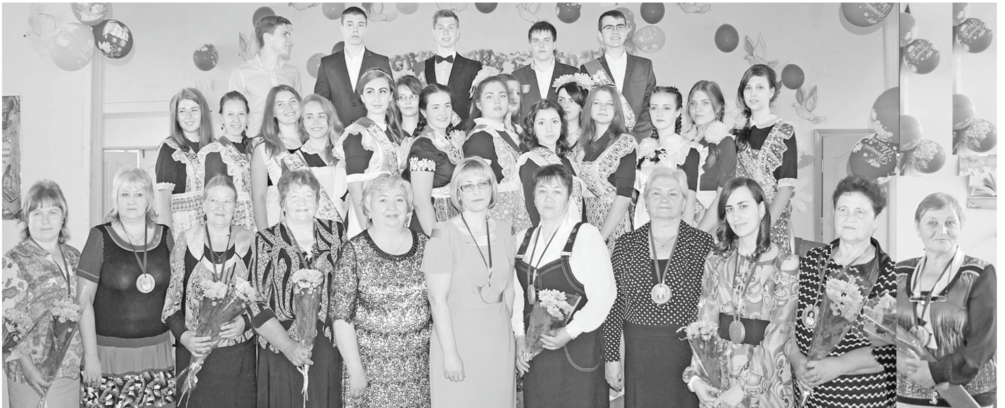
Думиничская средняя школа №1. Фото на память.