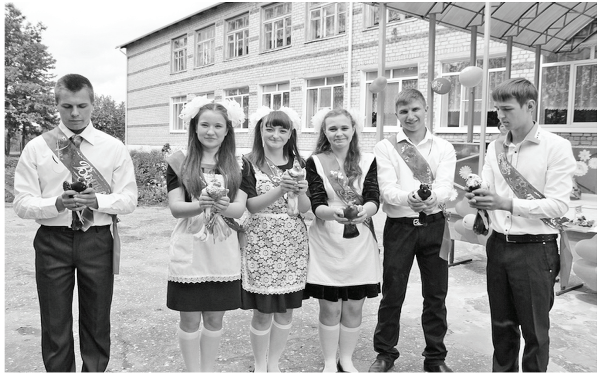
Вёртненские выпускники-2016.

Первоклассники - тоже герои дня, и поэтому приготовили большое выступление. Они пригласили выпускников на свой последний звонок - в мае 2026 года. И