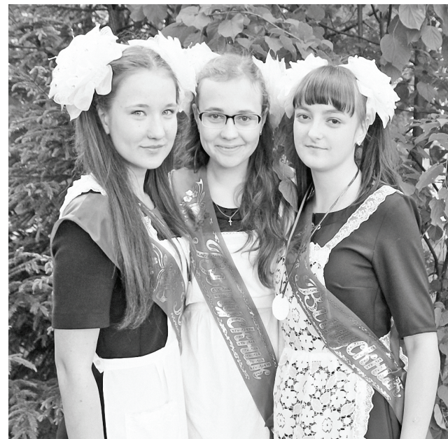
У вёртненских выпускниц - отличное настроение.

Торжественная линейка в Вёртненской средней школе стала по-настоящему праздничным событием. Она проходила перед школой под открытым небом. К началу мероприятия, словно по мановению волшебной палочки, расступились тучи, и выглянуло долгожданное солнышко, которое добавило каждому пришедшему порцию хорошего настроения.